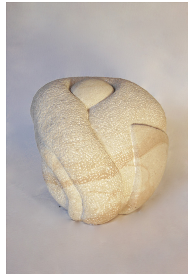
Skulptur i sandsten, 2007