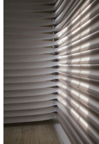
Afgangsprojekt, Fluid Space